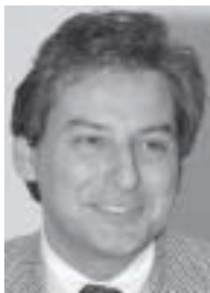
Brenno Martignoni Sindaco di Bellinzona

Gentili signore, egregi signori, ho pensato di strutturare il mio intervento di "relatore annunciato" (come indica il programma) fondamentalmente su tre concetti. Tre definizioni che hanno caratterizzato e caratterizzeranno lo sviluppo della cellula primordiale nell'ambito della politica delle aggregazioni ossia il Comune, vale a dire quell'unità operativa che consente il diretto contatto, quasi un anello di congiunzione, tra i vari interlocutori: cittadini, autorità, e enti pubblici di livello superiore (Confederazione e Cantone).