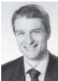
Claudio Moro Sindaco di Chiasso

Saluto tutti i presenti, i Consiglieri di Stato, ringrazio Coscienza svizzera per l'invito.