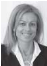
Carla Speziali Sindaco di Locarno

Intervista del moderatore audiovideo registrata presso il Municipio di Locarno, il 7 maggio 2005