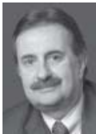
Giorgio Giudici Sindaco di Lugano

Intervista del moderatore audiovideo registrata presso il Municipio di Lugano, il 21 giugno 2005