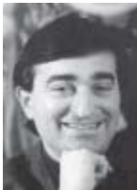
Marco Borradori Consigliere di Stato

Insieme al cantiere di AlpTransit, quello delle aggregazioni comunali rappresenta una delle riforme che incideranno maggiormente sull'assetto futuro del nostro territorio cantonale. Il Dipartimento del territorio che dirigo è stato coinvolto direttamente e indirettamente nel progetto delle fusioni, proprio per la fitta trama di temi legati al territorio, e alla sua gestione, con cui siamo continuamente confrontati. I rapporti con i Comuni e la collaborazione con i Consorzi sono molto frequenti: pianificazione, ambiente e qualità dell'aria, energia, trasporti e mobilità, sono tutte tematiche che vanno trattate con una continuità che non si arresta ai confini comunali. Il nostro spazio d'azione è dunque molto spesso sovracomunale e regionale.